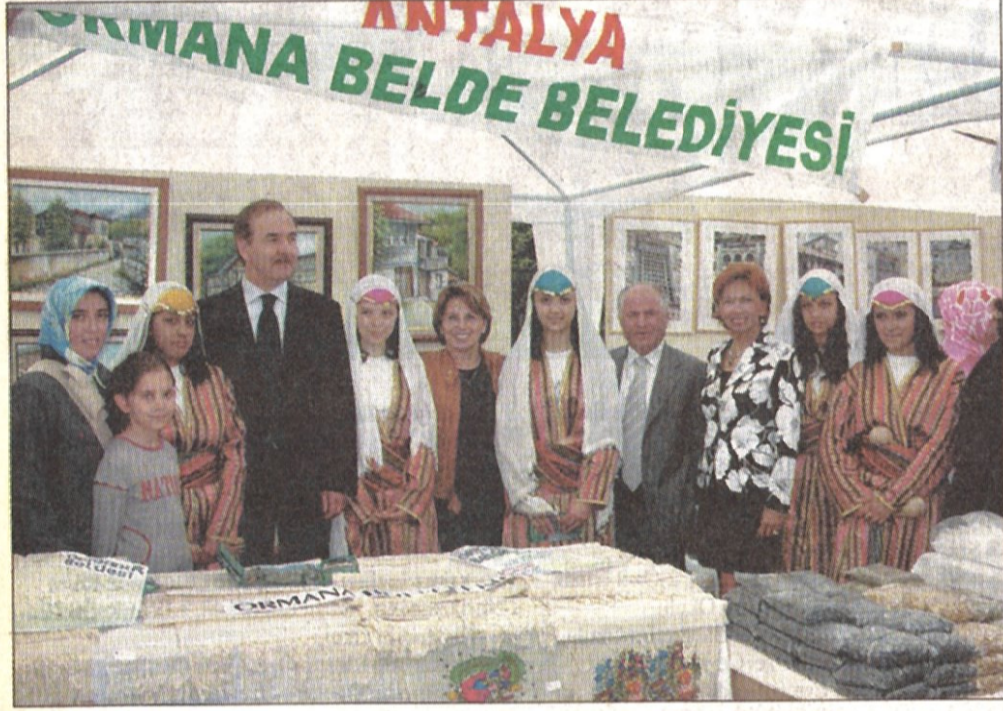
Şenliğe katılan dernekler kendi yörelerinin kültürünü tanıttılar...

K adıköy Belediyesi Caddebostan Gönüllüleri organizasyonunda Kadıköy'deki Hemşeri Dernekleri'nin katılımıyla düzenlenen "Kadıköy 4. Hemşeri Şenliği"nin bu yıl dördüncüsü gerçekleştirildi. "Kadıköy'de doğmadık ama Kadıköy'de yaşıyoruz, Kadıköy'ü seviyoruz" sloganıyla düzenlenen şenlik, Anadolu'nun değişik yerlerinden İstanbul'a göç ederek, yöre kültürlerini yaşatmak için Kadıköy'de dernek kuran kişilerin birliğiyle kaynaşmasını amaçlıyor. Konserlerin, halk oyunları gösterilerinin düzenlendiği, yöresel yiyeceklerin, el sanatları ve