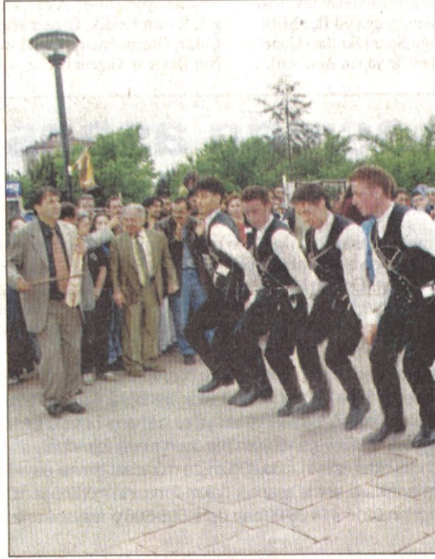
Halkoyunları gösterileri yapıldı...