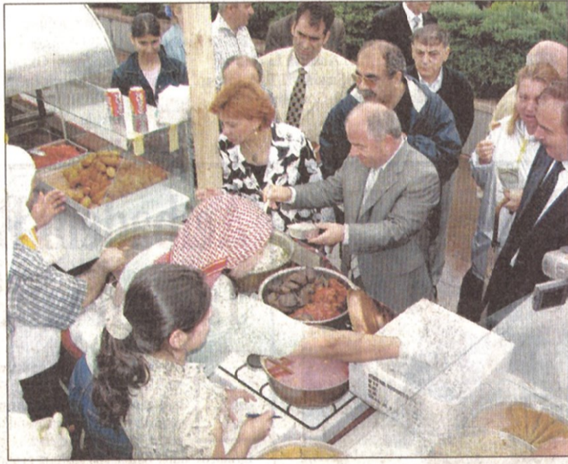
Birbirinden lezzetli yöresel yemekler de tadıldı...

İstanbul'da İSKİ tarafından 3,5 milyon dolar harcanarak yapılan altyapı çalışmaları sayesinde bu yaz 234 kilometrelik sahil şeridinin 138 kilometrelik bölümünde denize girilebilecek. Önümüzdeki yıl ise Avcılar ve Küçükçekmece sahillerinde de denize girilebilmesi için çalışmalar başlatıldı. Boğaziçi ve Marmara'da yapılan incelemelere göre bu yıl Küçükçekmece, Tuzla, Rumeli ve Anadolu Feneri ile Boğaziçi'nin pek çok noktasından denize girilebilecek. Yapılan araştırma sonucunda megakentin sahil şeridinin 21